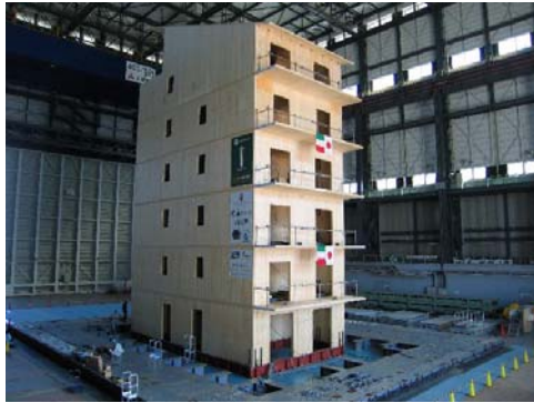
Figura 3: l'edificio SOFIE di 7 piani dopo tutti i test sismici