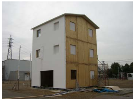
Figura 1: l'edificio SOFIE di 3 piani prima del test al fuoco (si noti la parte finita e la parte rimasta al grezzo).

fumi all'esterno della stanza e l'incendio non si è propagato al piano superiore in quanto la facciata rivestita di fibra di legno intonacata non ha costituito via di propagazione dell'incendio al piano superiore (figura 2).