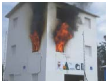
Figura 2: l'edificio SOFIE durante il test al fuoco