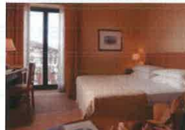
HOTEL KATANE PALACE, CATANIA