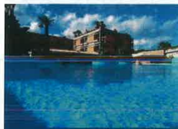
HOTEL SHERATON, CATANIA