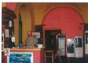
OSTELLO AGORA, CATANIA